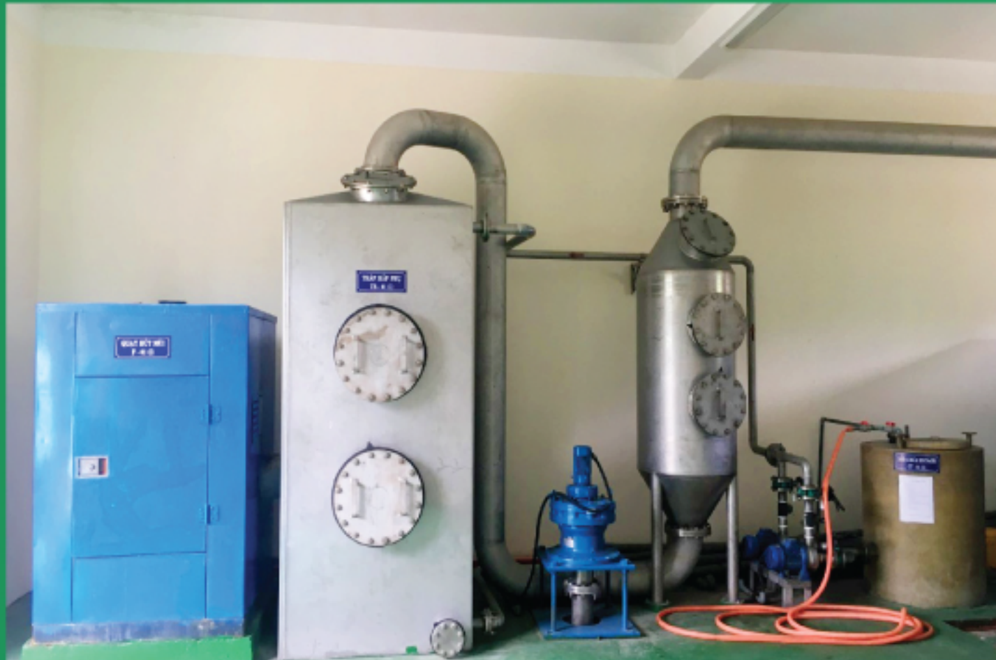
HỆ THỐNG XỬ LÝ HƠI ACID - NHÀ MÁY XỬ LÝ XI MĂNG YUJIN VINA